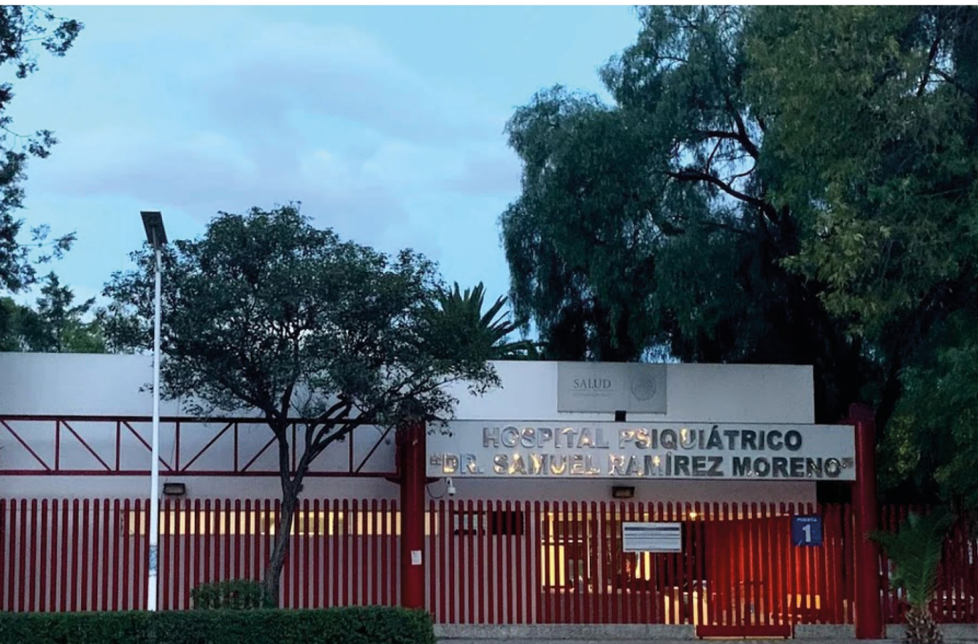
Hospital Psiquiátrico “Dr. Samuel Ramírez Moreno”

ÚNICO. Se propone al H. Consejo Universitario que sea aprobada la adenda al programa académico de la Especialidad en Psiquiatría para la apertura de una nueva sede en el Hospital Psiquiátrico “Dr. Samuel Ramírez Moreno”, de la Comisión Nacional de Salud Mental y Adicciones de la Secretaría de Salud federal, presentada por la Facultad de Medicina.