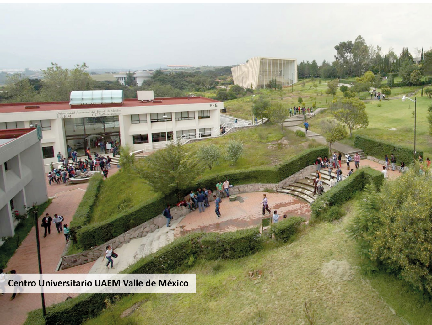
Centro Universitario UAEM Valle de México

ÚNICO. Se propone al H. Consejo Universitario que sea aprobada la adenda al programa académico del Doctorado en Ciencias de la Ingeniería, presentada por la Facultad de Ingeniería y el Centro Universitario UAEM Valle de México.