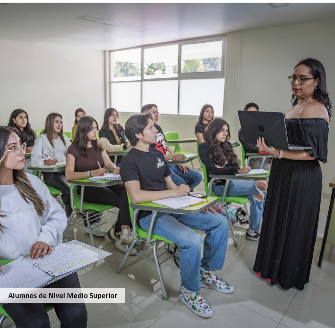
Alumnos de Nivel Medio Superior