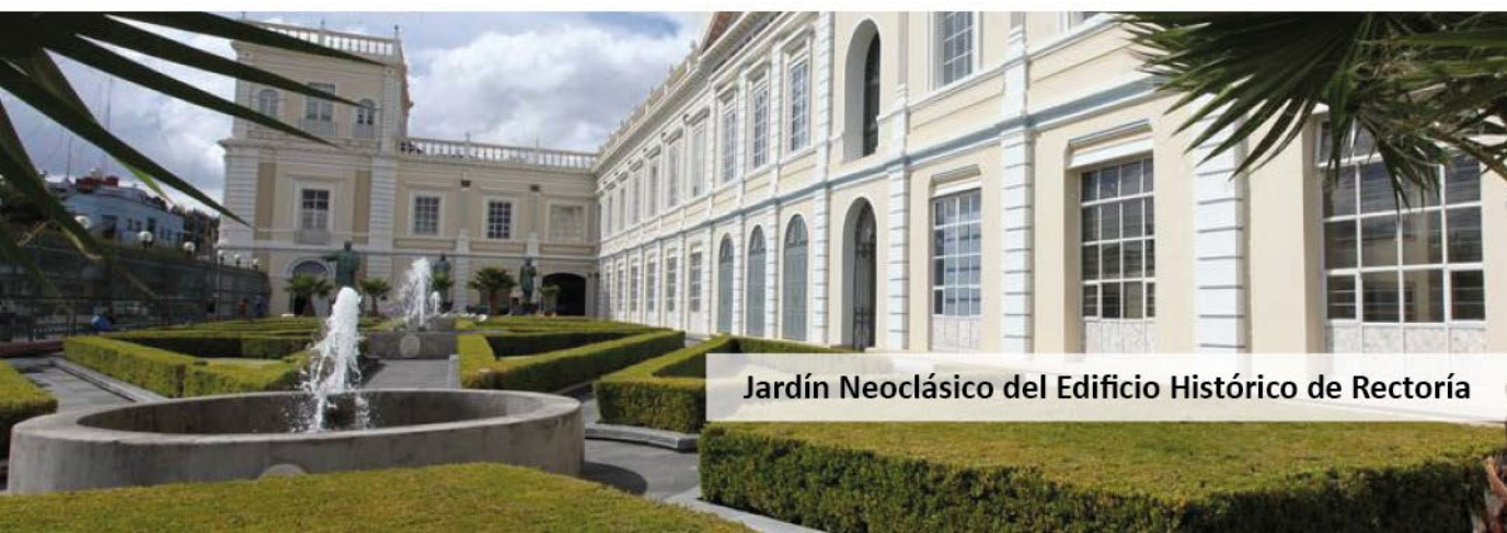
Jardín Neoclásico del Edificio Histórico de Rectoría