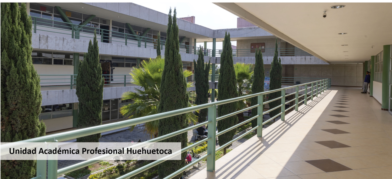
Unidad Académica Profesional Huehuetoca